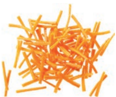
Karottenstreifen (3 mm)