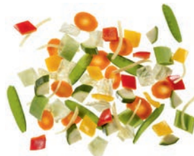
Wokgemüse „Bangkok“ Chinakohlstreifen (20 mm) | Karottenscheiben (2 mm) | Zucchiniwürfel (20 mm) | Zuckerschoten | gelbe Paprikawürfel (20 mm) | rote Paprikawürfel (20 mm) | Lauchstreifen (20 mm) | Bambusstreifen | Weißkrautstreifen (20 mm)