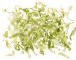
Eisbergsalat (6 mm)