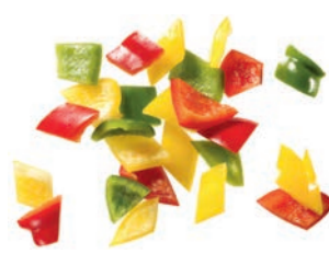
Paprika Mix Würfel (20 mm)