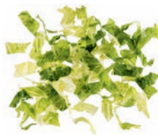
Romanaherzen (30 mm)