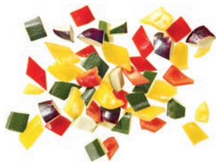
Pfannengemüse „Ratatouille“ (20 mm)

Auberginenwürfel | Zucchiniwürfel | rote Paprikawürfel | gelbe Paprikawürfel