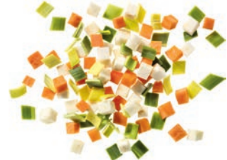
Suppengemüse „Wurzelsepp“ Karottenwürfel (10 mm) | Selleriewürfel (10 mm) | Lauchringe (3 mm)