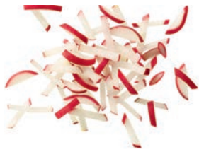
Radieserlstifte (3 mm)