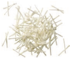
Selleriestreifen (2 mm)