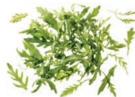
Rucola ganze Blätter