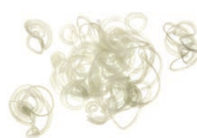
Zwiebelringe weiß (2,5 mm)