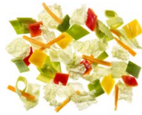
Wokgemüse „China“ Chinakohlstreifen (20 mm) | Weißkrautstreifen (20 mm) | Lauchstreifen (20 mm) | rote Paprikawürfel (20 mm) | gelbe Paprikawürfel (20 mm) | Karottenstifte (5 mm)