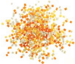
Suppengemüse „Brunoise“ (5 mm) Karottenwürfel | Selleriewürfel | gelbe Rübenwürfel