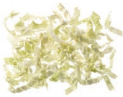
Chinakohl (10 mm)