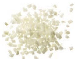
Zwiebelwürfel weiß (5 mm)