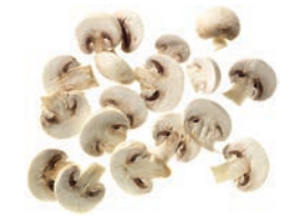
Champignonscheiben (10 mm)