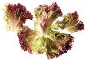
Lollo rosso ganze Blätter