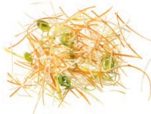
Suppengemüse „Esterhazy“ Karottenjulienne (2 mm) | Selleriejulienne (2 mm) | Lauchringe (3 mm)