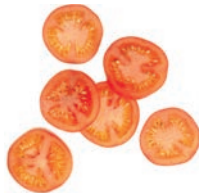
Tomatenscheiben (5 mm)