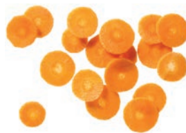
Karottenscheiben (2 mm)