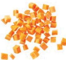
Karottenwürfel (10 mm)