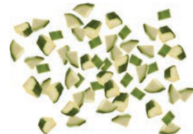
Zucchini scheiben geviertelt