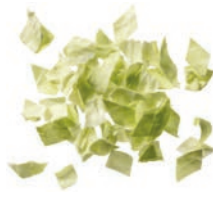
Weißkrautfleckerl (20 mm)