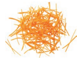
Karottenstreifen (2 mm)