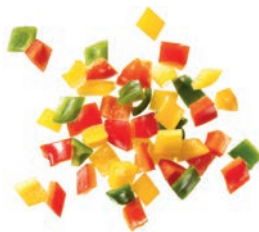
Paprika Mix Würfel (10 mm)