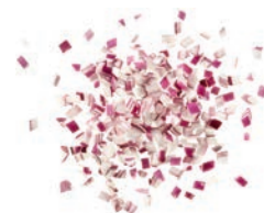
Zwiebelwürfel rot (5 mm)