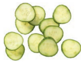
Salatgurkenscheiben (5 mm)