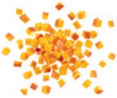
Von September bis Dezember Hokkaidokürbiswürfel (10 mm)