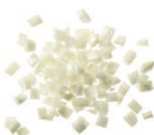
Zwiebelwürfel weiß (10 mm)