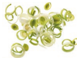
Lauchringe (3 mm)