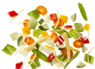
Wokgemüse „Asia“ Karottenscheiben (2 mm) | Chinakohlstreifen (20 mm) | Pak Choi Fleckerl (30 mm) | rote Paprikawürfel (20 mm) | gelbe Paprikawürfel (20 mm) | kleine Maiskölbchen | Zucchiniwürfel (20 mm) | Zuckerschoten | Lauchstreifen (20 mm) | Bambusstreifen