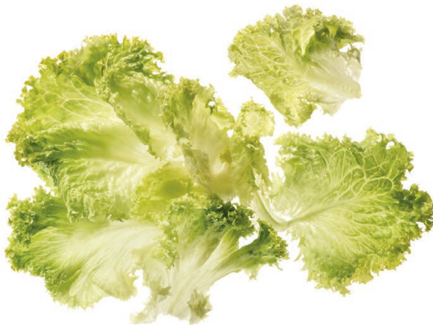
Lollo bionda ganze Blätter