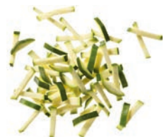
Zucchini stifte (5 mm)