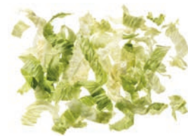
Eisbergsalat (20 mm)