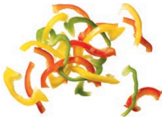
Paprika Mix Streifen (5 mm)