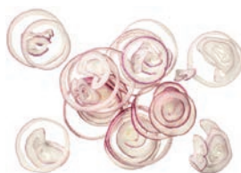
Zwiebelringe rot (2,5 mm)