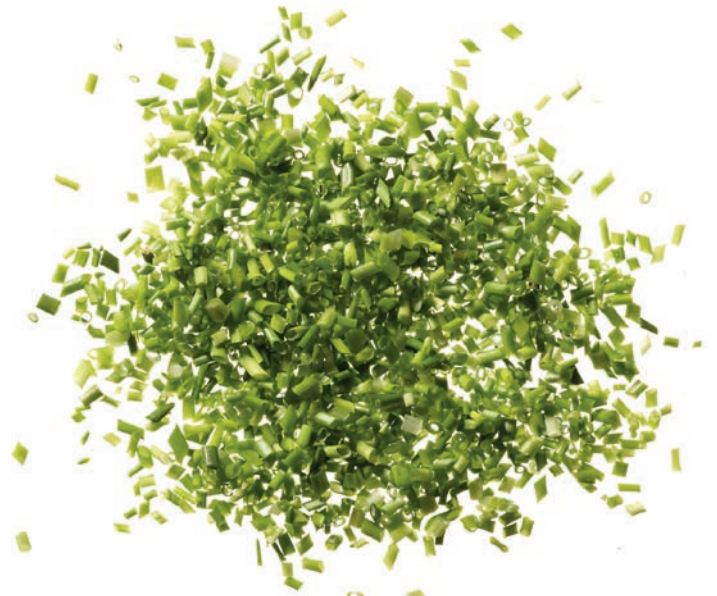
Schnittlauchröhrchen (2–3 mm)